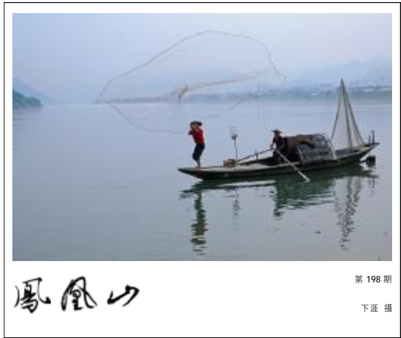
第 198 期

你别说你懂爱情 因为爱情是个迷 懂得越多 痛得越深 别再说你懂爱情 因为爱情是张网 进得越快 黏得越牢 别说你找爱情 因为爱情看不见 摸不着 用你的灵魂去感悟 才能回到她的芳香 别说你爱爱情 因为爱情说来就来 说走就走 捧最珍贵的心 动最真挚的笑 换回她给你的每一天的幸福